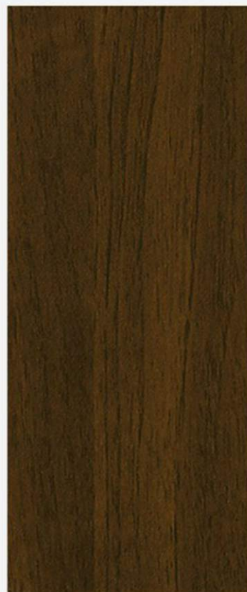
PK A7 CILIEGIO