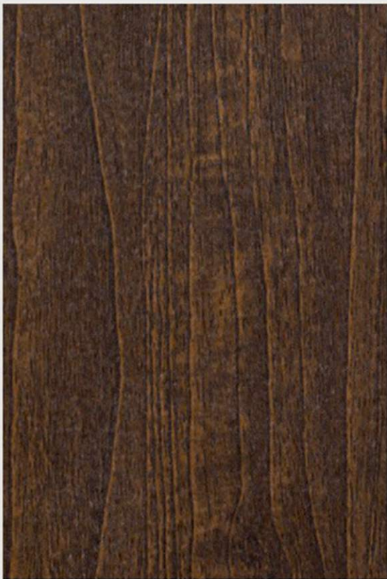
PK E1 NOCE NAZIONALE