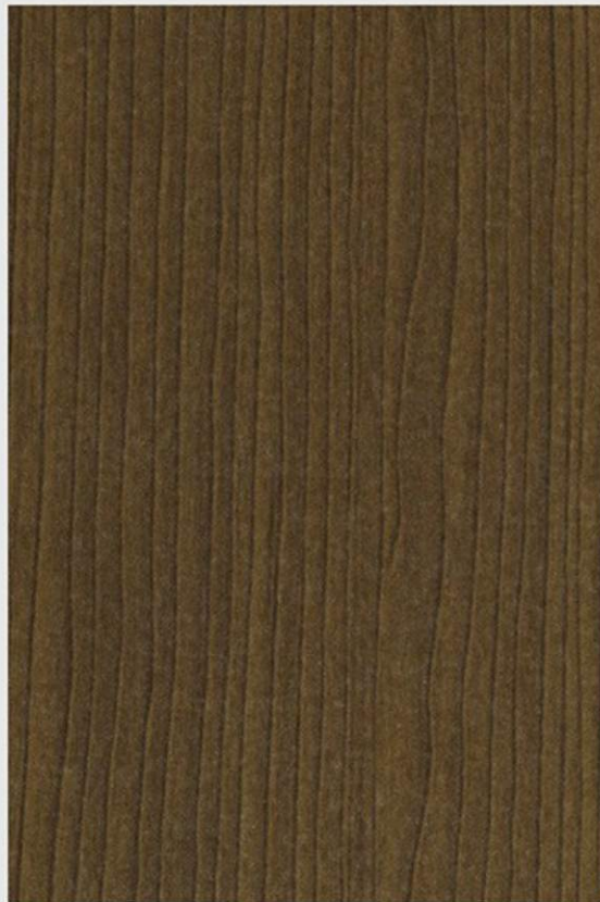
PK E2 CILIEGIO