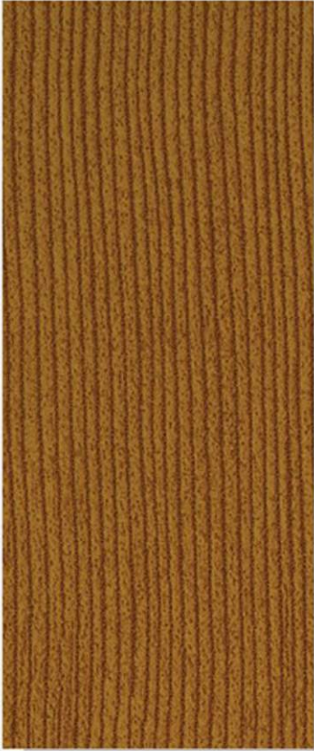
PK A10 DOUGLAS