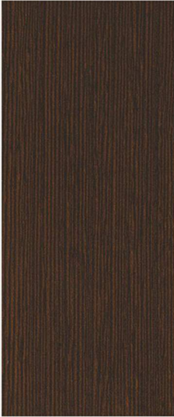
PK A42 WENGHÉ