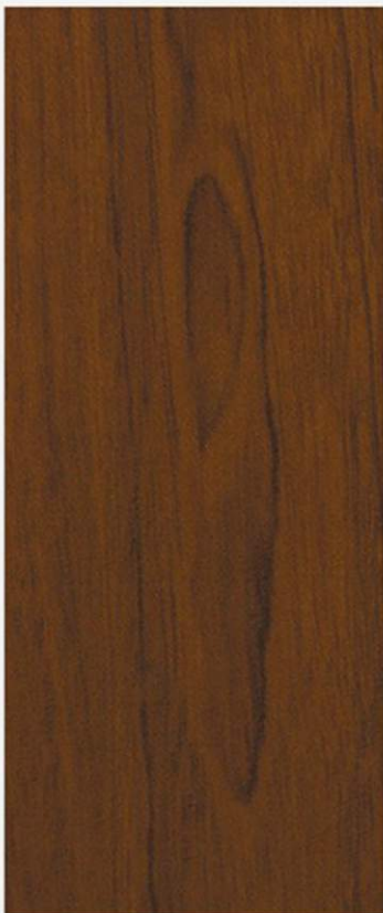
PK A21 NOCE NAZIONALE