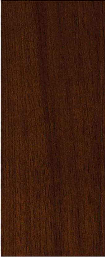
PK N3 NOCE MEDIA