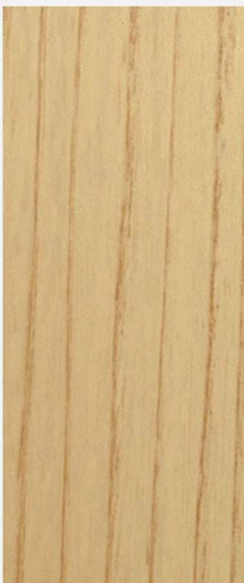
PK A40 ROVERE SBIANCATO