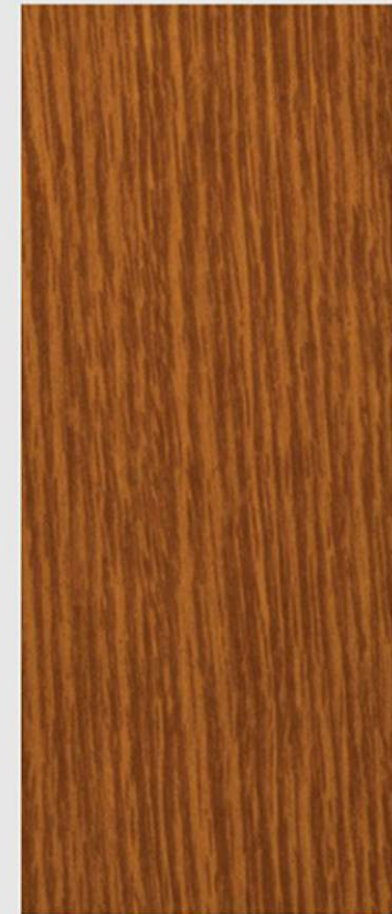
PK R1 ROVERE