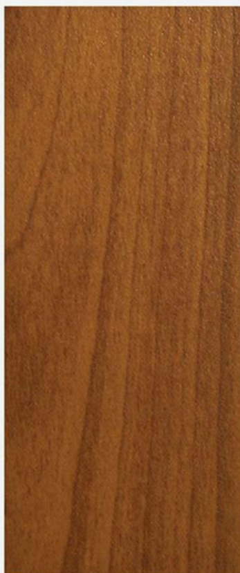
PK A19 CILIEGIO FIAMMA FIAMMA CHIARO