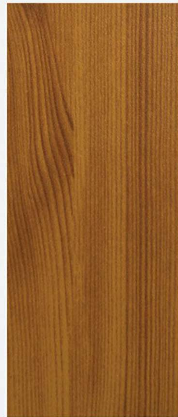
PK A9 PINO