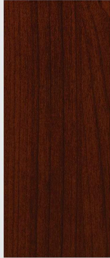
PK C5 CILIEGIO FIAMMATO SCURO