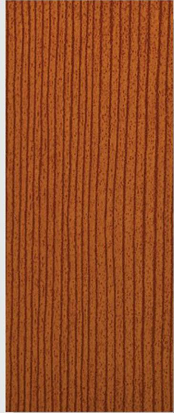
PK D1 DOUGLAS