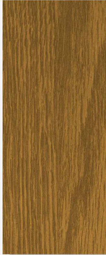
PK A11 ROVERE