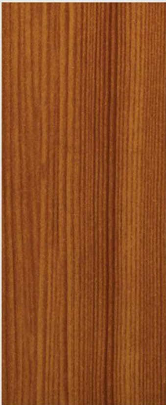
PK P2 PINO MEDIO