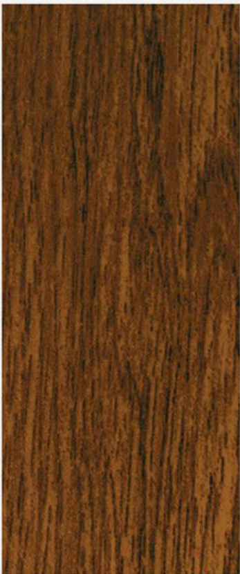
PK A16 NOCE FRANCIA