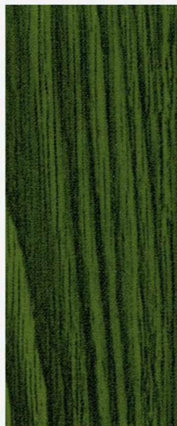
PK A5 NOCE VERDE