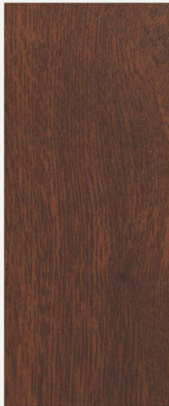
PK A18 NOCE FRANCIA SCURA