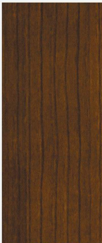
PK A25 CASTAGNO ANTICO