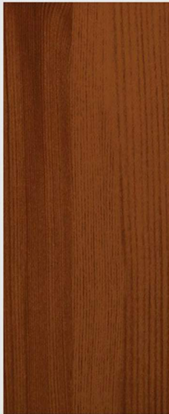
PK P3 PINO SCURO