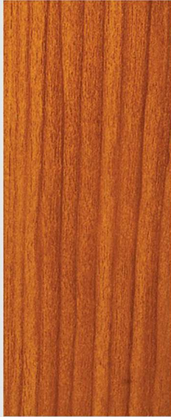
PK C3 CILIEGIO CANADESE