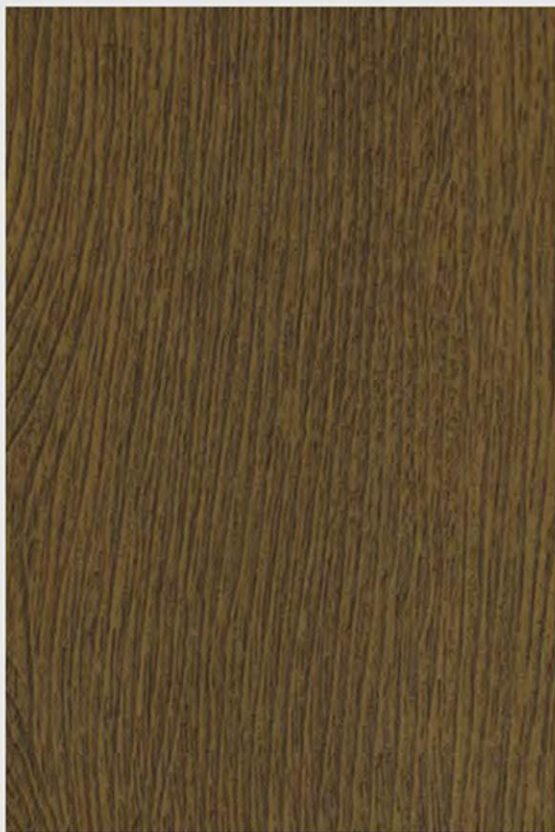
PK E5 ROVERE FRANCESE