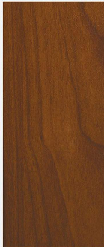
PK A2 NOCE FIAMMATA