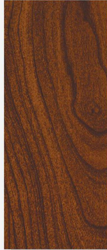
PK A24 CASTAGNO RUIDO