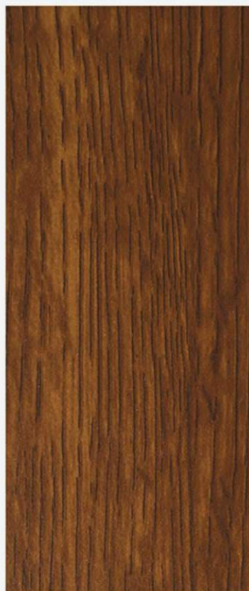
PK A20 ROVERE ANTICO