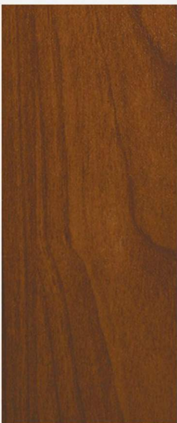
PK A22 CILIEGIO FIAMMA FIAMMA SCURO