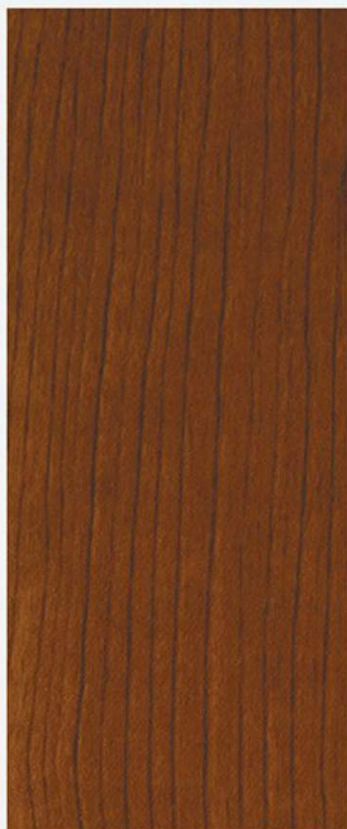
PK A23 CASTAGNO TOSCANO SCURO