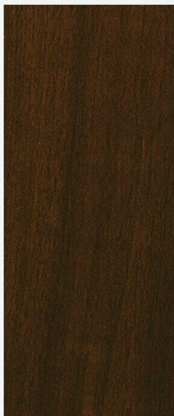
PK A3 NOCE