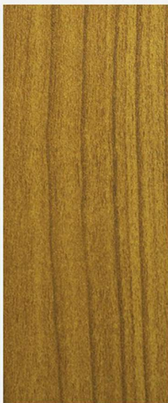
PK A8 CILIEGIO CANADESE